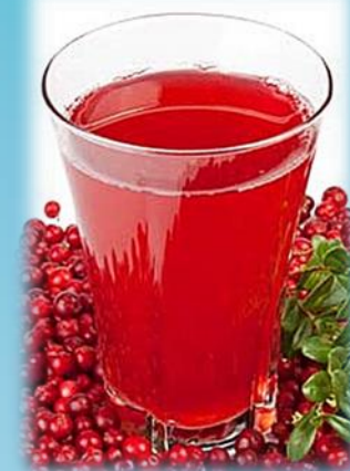
Морс из ягод