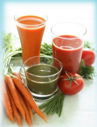
Натуральные соки фруктов и овощей